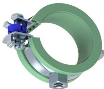
REF.1513 (1 tornillo)